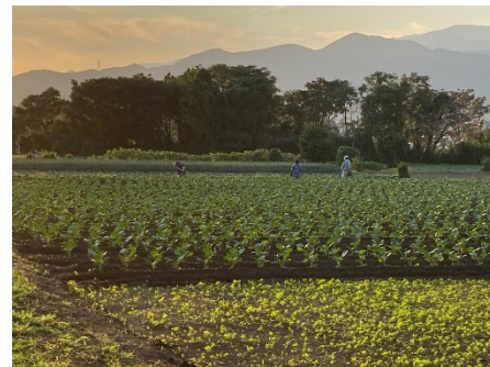
↑ 城所山のキャベツ畑